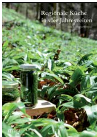
Regionale Küche in vier Jahreszeiten